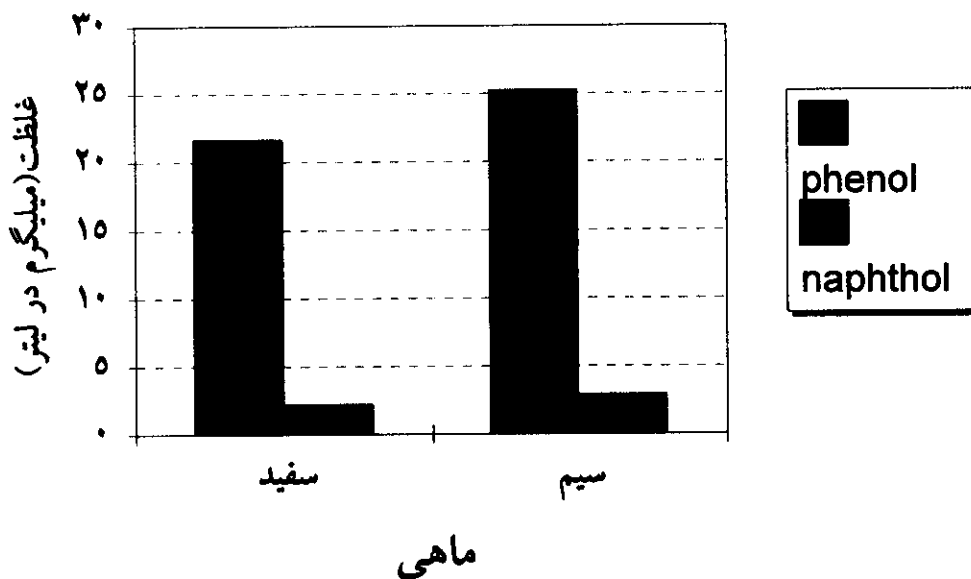
نمودار ۳: مقایسه سمیت فنل و ۱-نفتول برای ماهیان مختلف