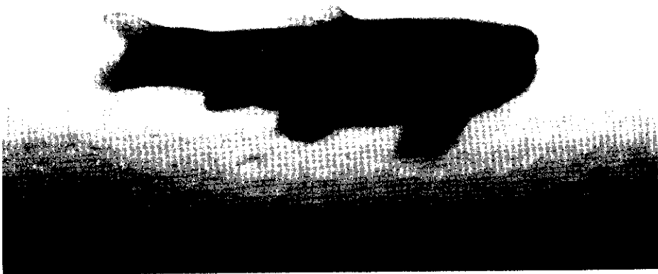
شکل ۱: Garra rossica