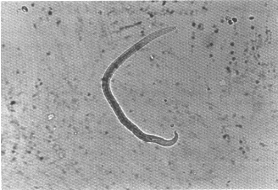
شکل ۱: لارو نماتود مشاهده شده در میگوهای مولد دریایی، بزرگنمایی ۶۸۰ ×