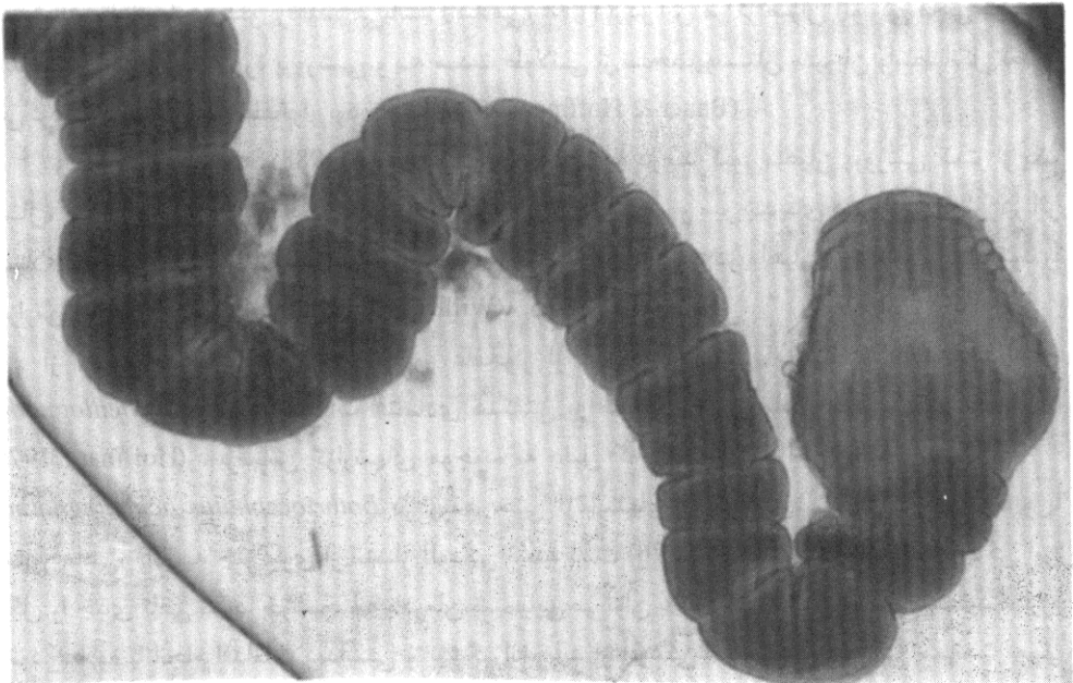
شکل ۲: انگل بوتریوسفالوس جدا شده از روده ماهی فیلیپی