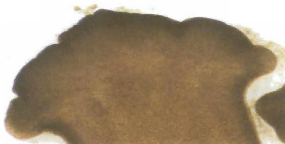
شکل ۴: Caryophyllaeus fimbericeps بزرگنمایی ۱۰×