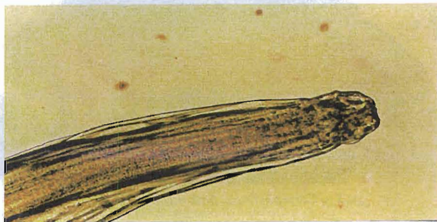
شکل ۱: قسمت قدامی Raphidascaris acus بزرگنمایی ۲۰×

اولین انگل Raphidascaris acus بود که تنها در دو ماهی سرخ باله و اردک ماهی مشاهده شد، بطوریکه میزان شیوع انگل، میانگین شدت آلودگی انگل \pm انحراف معیار، میانگین فراوانی انگل \pm انحراف معیار و دامنه تعداد انگل در اردک ماهی به ترتیب، ۱۵/۴ درصد، ۱۱ \pm ۱۱/۱۵ عدد، ۱/۶۹ \pm ۵/۷۰ عدد و ۱ تا ۳۰ عدد و برای ماهی سرخ باله این موارد به ترتیب ۲۰/۲ درصد، ۱/۸ \pm ۰/۸۳ عدد، ۰/۳۸ \pm ۰/۸۳ عدد و ۱ تا ۴ عدد بود (جدول ۱). در بین فصول مختلف نیز برای هر دو ماهی سرخ باله و اردک ماهی بیشترین آلودگی در فصل زمستان بدست آمد (جدول ۴). براساس مقایسه آماری انجام گرفته بوسیله