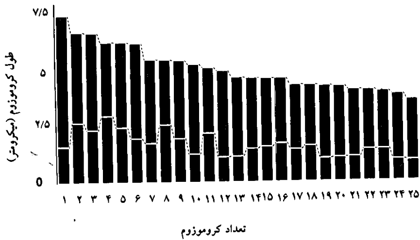
نمودار ۱: ایدیوگرام هاپلوئیدی ماهی گل چراغ ( Garra rufa )، n=25 .