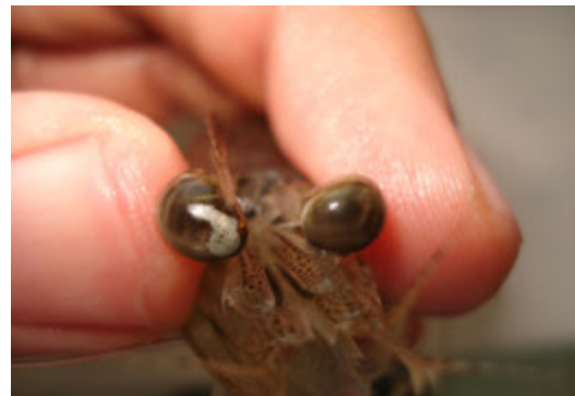
شکل ۱: حضور لکه‌های سفید در چشم میگو

مختلف نمونه‌برداری صورت گرفته به آزمایشگاه ارسال شد در کل ۲۰ نمونه میگوی زنده جهت آزمایشات باکتری شناسی، ۶ میگوی کامل ثابت شده جهت آزمایشات بافتی، ۳۵ نمونه پای شنا جهت انجام آزمایشات واکنش زنجیره ای پلی‌مرز اخذ و به آزمایشگاه ارسال شد. به منظور انجام آزمایشات واکنش زنجیره‌ای پلی‌مرز (PCR) یک عدد از پای شنای میگوها کنده و درون یک لوله ۱/۵ میلی‌لیتری قرار داده شده و بلافاصله در کنار