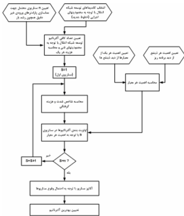
شکل ۱- فلوجارت الگوریتم پیشنهادی

D_{kj} : دوره زمانی حذف بار در باس k ام با هدف حذف اضافه بار ناشی از شرایط اضطراری Z_{am} و F_j : فرکانس وقوع شرایط اضطراری Z_{am} است. در این الگوریتم جهت تصمیم گیری در یک محیط با چند سناریو و چند ذینفع از روش آنالیز سناریو ارایه شده در مرجع [۲۶] استفاده شده است. با توجه به ساختار بازار برق ایران سه ذینفع دولت، تولیدکنندگان و مصرف کنندگان در نظر گرفته شده اند. دولت در این ساختار در نقش بهره بردار، قانون گذار و مالک شبکه انتقال ظاهر می شود.