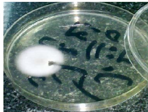
شکل ۱: کلنی قارچ تریکوفیتون منتاگروفیت بر روی محیط سابورو دکستروز آگار (سمت راست) و ساختمان میکروسکوپی آن (سمت چپ)