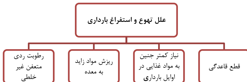
نمودار ۱. علل تهوع و استفراغ بارداری در طب سنتی ایران