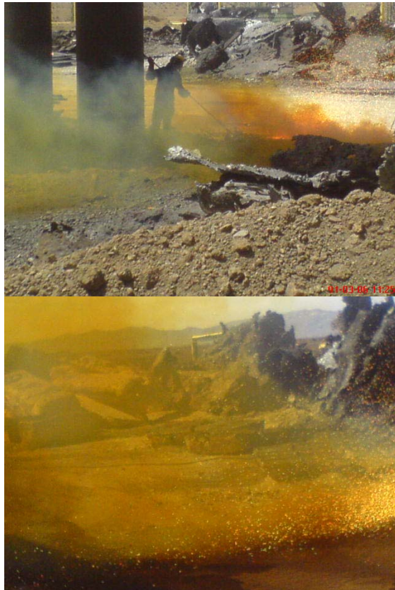
شکل ۱. تراکم بالای فیوم‌های ناشی از برش فلزات قراضه در واحد مورد مطالعه و نحوه مواجهه افراد

منطقه تنفسی کارگران مطابق روش ۷۳۰۰ و ۷۰۴۸ سازمان NIOSH انجام گرفت. دلیل انتخاب تمامی کارگران برای نمونه‌برداری، تنوع فلزات برش داده‌شده و فیوم‌های حاصله بوده است.