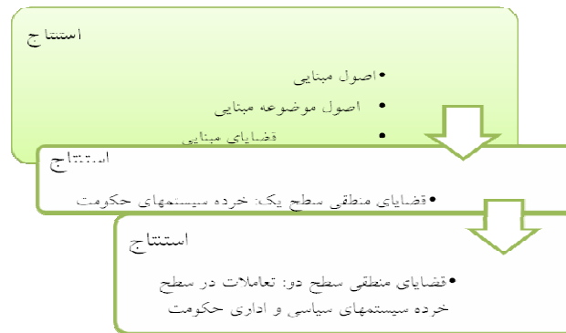
شکل ۳: مراحل استنتاج منطقی فضایا

نکته بسیار مهم و قابل تأمل آن است که در همه عرصه‌ها و خرده سیستم‌های حکومتی بر ضرورت کنترل متقابل و در عین حال، وحدت و هم‌نوایی خرده سیستم‌های اداری و سیاسی تأکید می‌شود. در این شأن این خرده سیستم‌ها جدا نیستند، هر چند مستقل از یکدیگرند، موظف به کنترل یکدیگر در جهت نیل به اهداف اصیل جامعه‌اند.