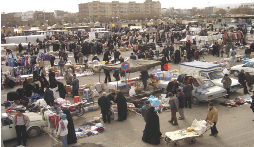
شکل (۱) تصویری از فعالیت‌های بخش غیررسمی در سبزه میدان تبریز