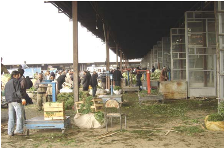
شکل (۲) تصویری از فعالیت‌های مربوط به تره‌بار در سبزه میدان تبریز