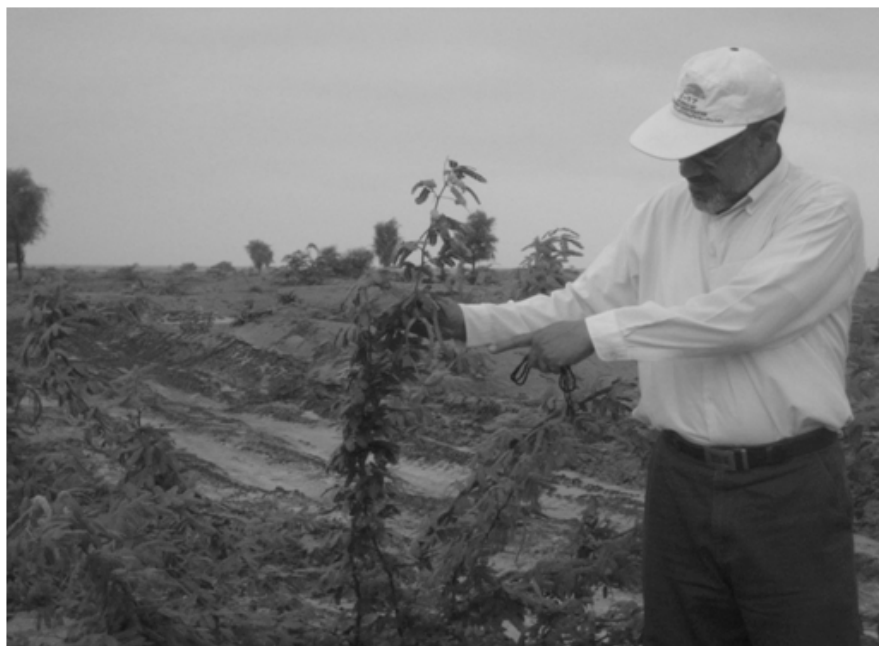
شکل شماره ۲- نهال سمر در پایان سال دوم