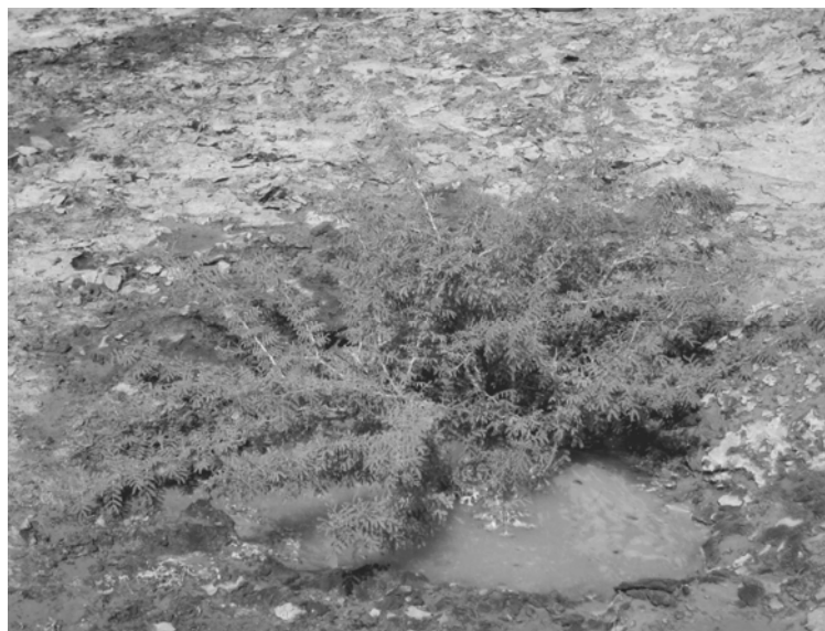
شکل ۱- نهالکاری با گونه مغیر - پایان سال اول

به منظور مقایسه میزان رشد نهالها، در پایان سال اول و دوم به اندازه گیری سطح تاج پوشش نهالها برای هر گونه به روش اندازه گیری سطح تاج همه پایه ها، اقدام گردیده است. (آنچه که در این تحقیق به عنوان رشد مدّ نظر بوده، میزان تاج پوششی است که در پایان سال اول و دوم ایجاد می‌نماید)؛ همچنین درصد زنده مانی نهالها و طول فصل خزان در منطقه نیز به تفکیک گونه برآورد شده است. اشکال (۱) و (۲) وضعیت دو گونه مغیر و سمر را به ترتیب در پایان سال اول و دوم نشان می‌دهد.