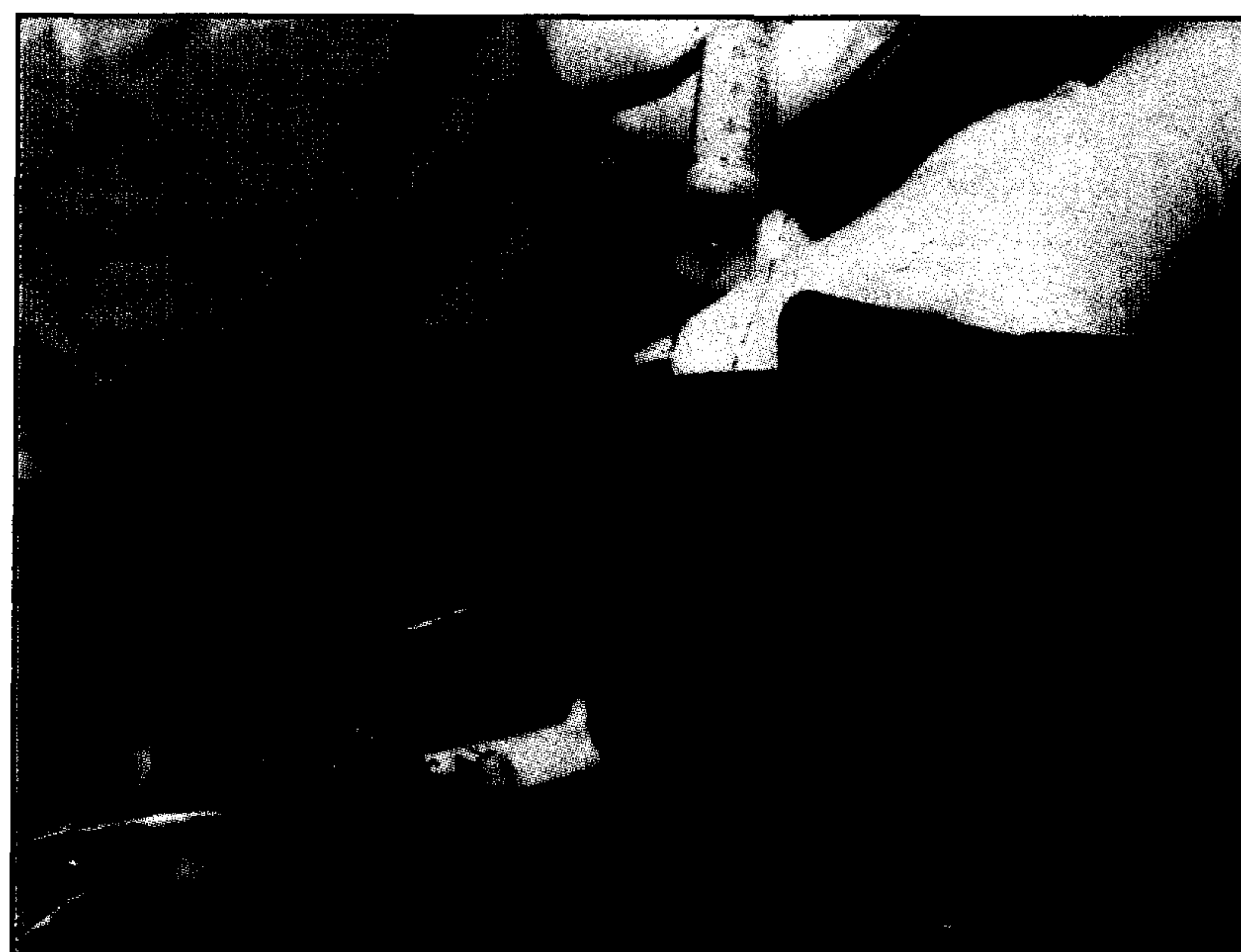
تصویر ۶ - بررسی نشت از لبه های پیوند مثانه با کیسه آمنیون.