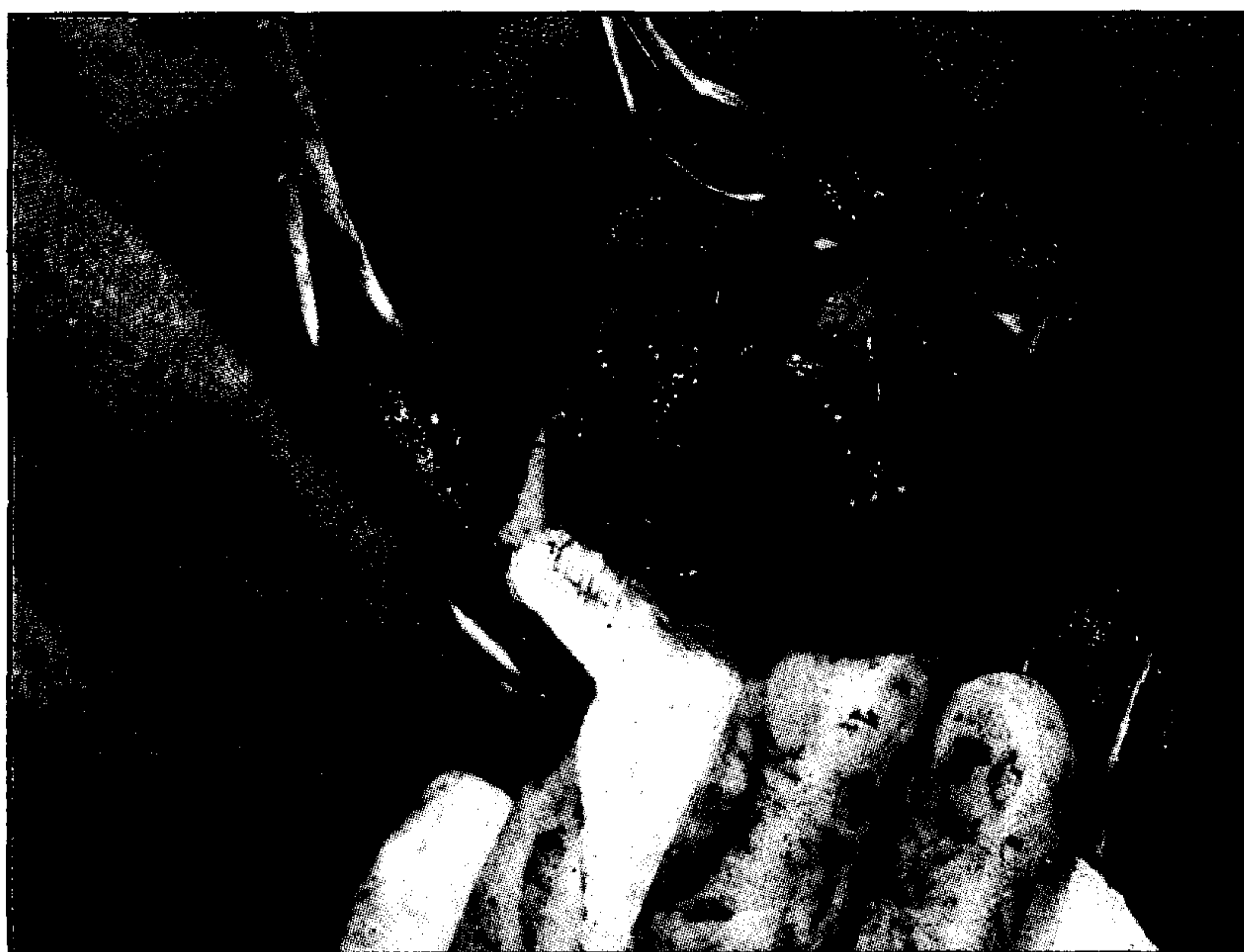
تصویر ۵ - کیسه آمنیون با بخیه ساده سرتاسری به وسیله نخ ابریشم سه صفر (۳/۰) در محل برش مثانه.