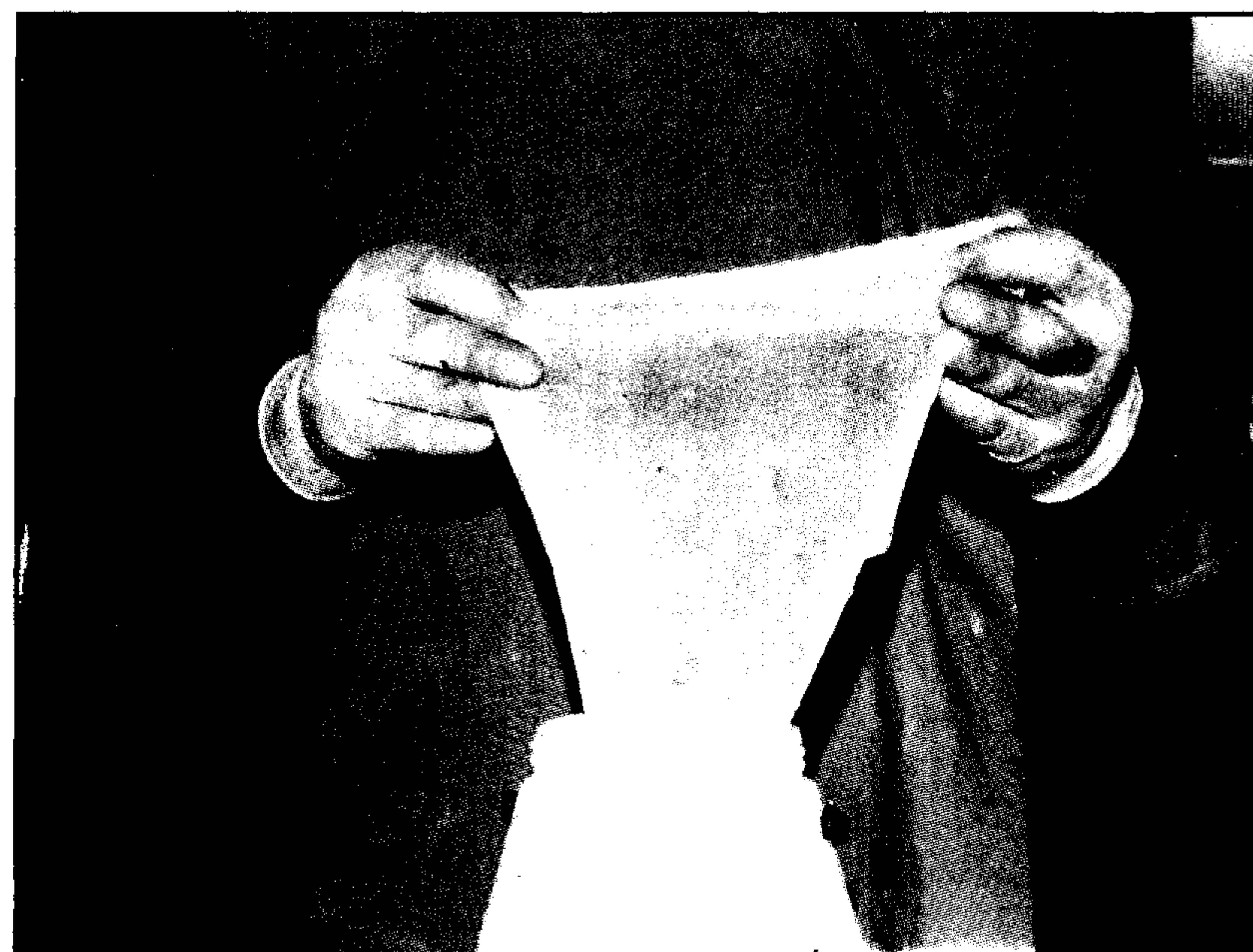
تصویر ۴ - تصویر ظاهری کیسه آمنیون برای پیوند در مثانه.