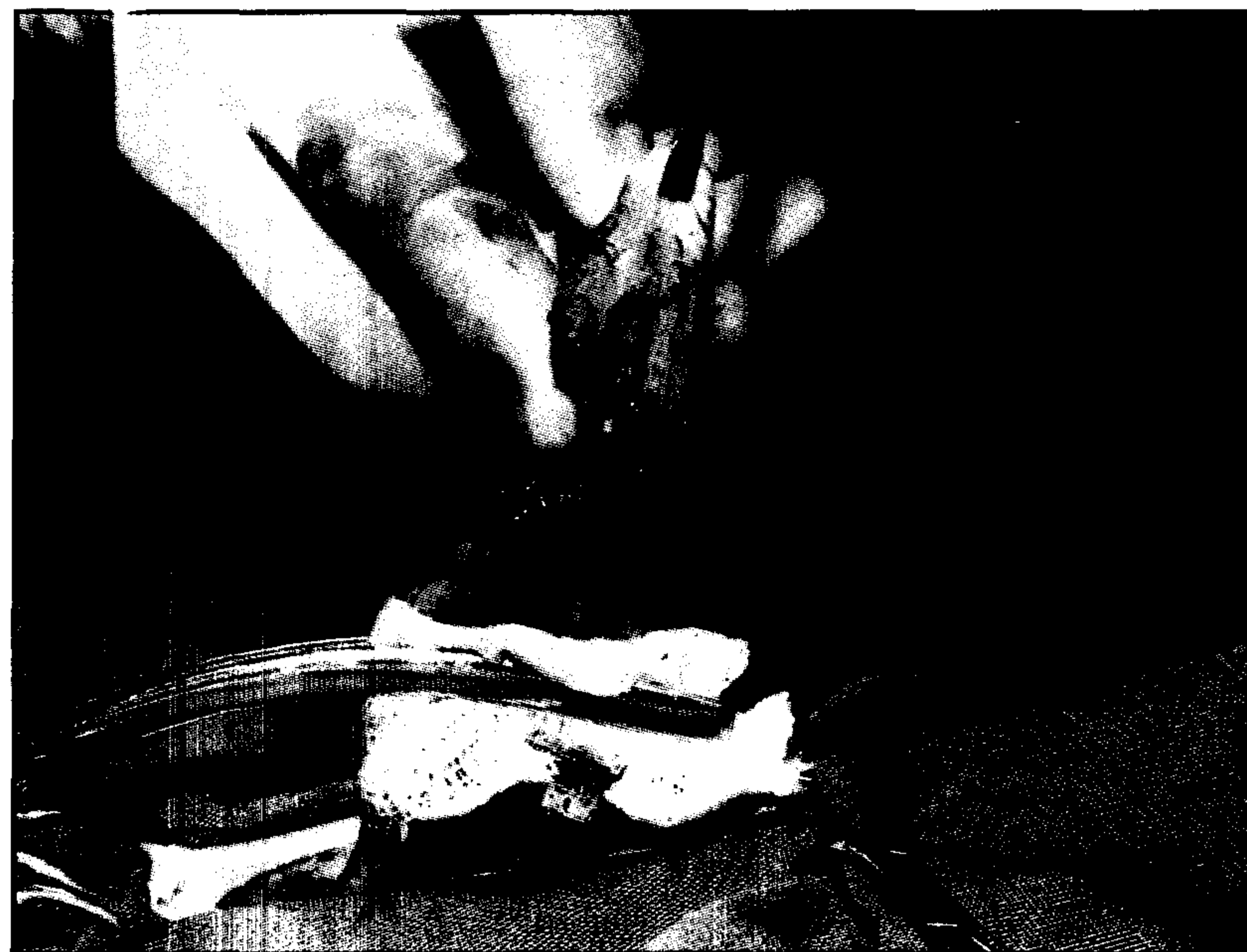
تصویر ۲ - برش مثانه با اسکالپل پس از تثبیت مثانه با پنس روده گیر و تامپون.