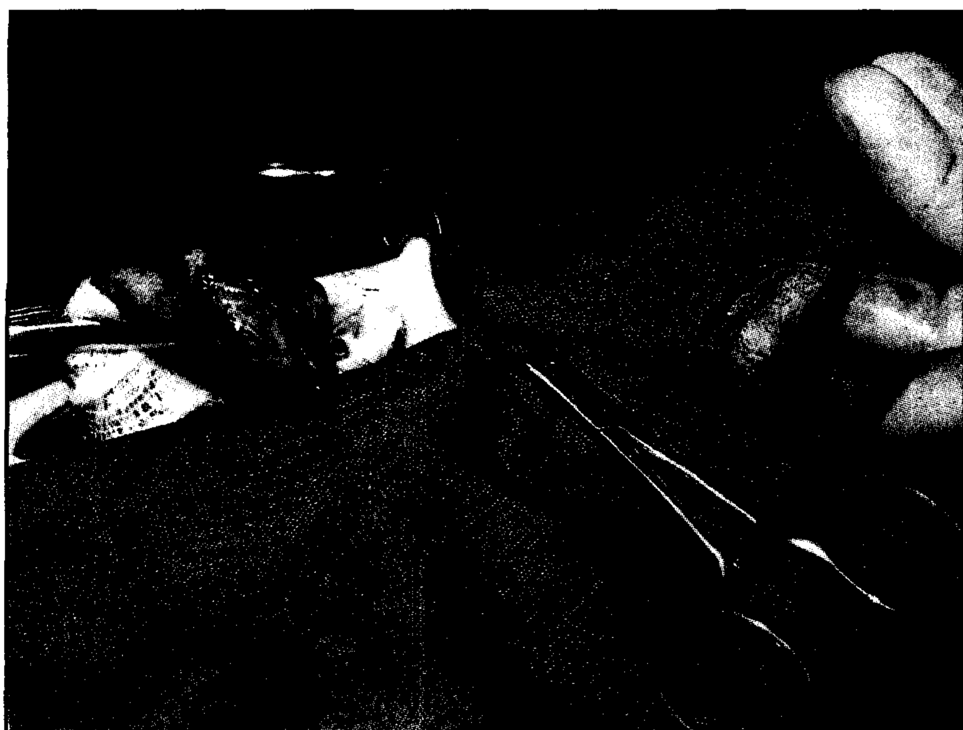
تصویر ۳ - قسمت بریده شده مثانه برای پیوند و اندازه مقطع بریده شده.