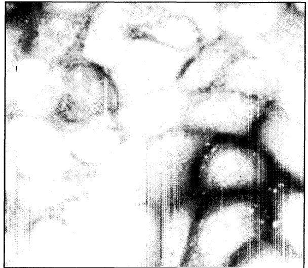
تصویر ۱ - الف) فلئورسنت سبز درخشان در نمونه‌های مثبت در مقایسه با ب) فلئورسنت زمینه‌ای در موارد منفی.

لوله‌ها در ۸۰۰۰۰g (۲۶۰۰۰ دور در دقیقه) در درجه حرارت ۴ درجه به مدت ۲ ساعت اولترا سانتریفوز گردید. مایع رویی دور ریخته شده و رسوب باقیمانده را پس از حل کردن در ۱/۱۰ حجم اولیه در بافر به‌عنوان پادگن جهت انجام آزمایش مورد استفاده قرار می‌گیرد.