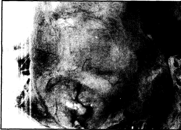
تصویر ۲- نشانه‌های کالبد گشایی جوجه مبتلا به آسیت.