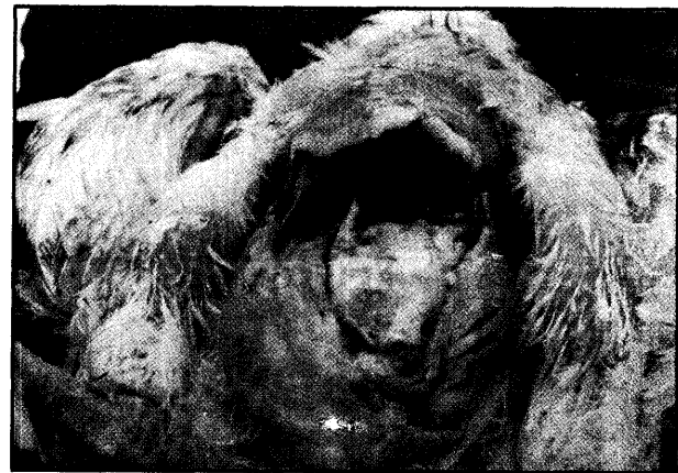
تصویر ۳- نشانه‌های کالبد گشایی جوجه مبتلا به CRD.

مقایسه تعداد ضربان قلب، فواصل، دامنه و شکل امواج مختلف الکتروکاردیوگرام سه گروه در جدول (۱، ۲، ۳، ۴) آمده است.