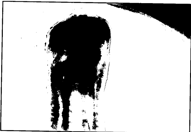
تصویر ۲- انگل اوسترونزیلیدس اکسیسوس (ناحیه دم) بزرگنمایی ۱۰۰.