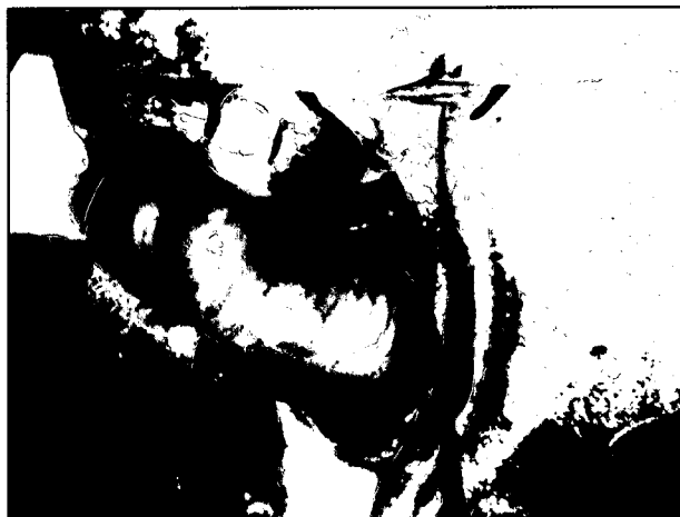
تصویر ۲- استقرار توپی کروی متصل شده به کاتیتر در داخل محوطه لگنی.

در فصل تولید مثلی، جفتگیری کردند و آبستنی آنها با عدم برگشت مجدد به فحلی تشخیص و با اندازه‌گیری میزان پروژسترون پلاسمای خون محیطی با استفاده از روش الایزا در روزهای ۱۵-۱۸ بعد از جفتگیری و در صورت بالا بودن میزان آن از ۵ نانوگرم در هر میلی‌لیتر، تأیید شد. گوسفندان آبستن تا پایان ماه دوم آبستنی در محلی با دسترسی کامل به یونجه و آب در حد کافی نگهداری شدند.