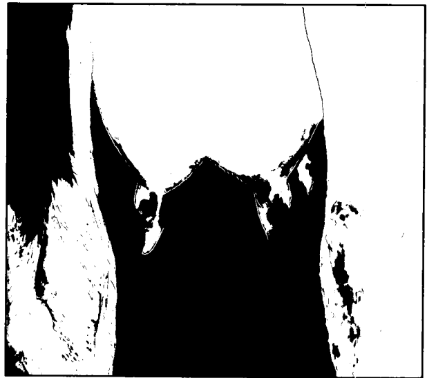
تصویر ۱ - وضعیت قرار گرفتن سرپستانکهای عقب قبل از عمل جراحی.