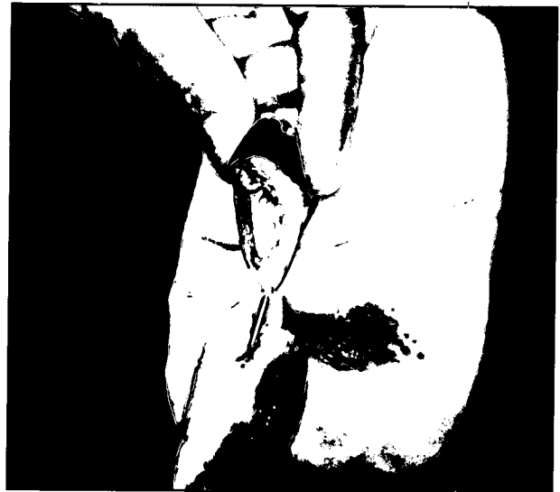
تصویر ۳ - انجام بخیه نگهدارنده بین پوست لبه میانی هردو سرپستانک.