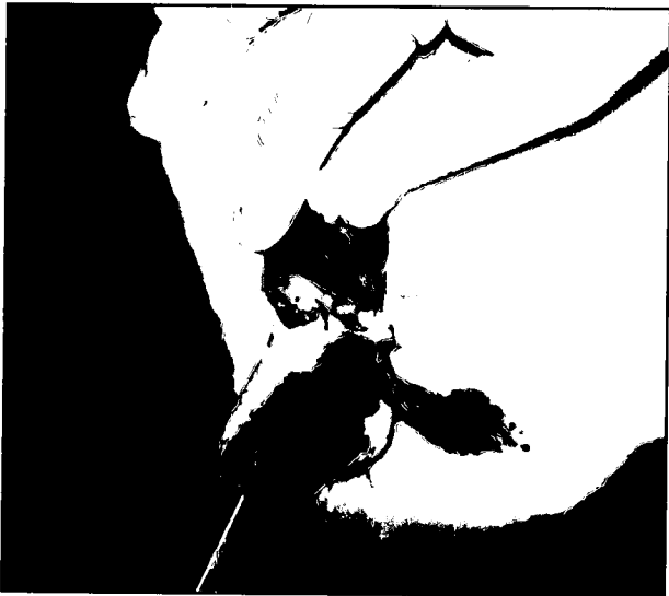
تصویر ۴ - بخیه مخاط سرپستانکها با الگوی ساده تک.