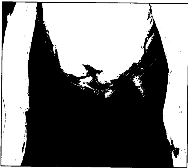
تصویر ۶ - وضعیت نهایی قرار گرفتن سرپستانکهای عقب پس از ایجاد همدهانی.