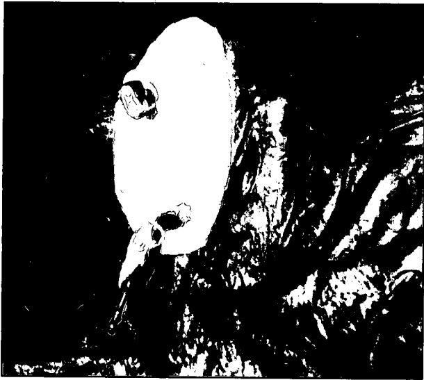
تصویر ۲ - سرپستانک بالایی (چپ عقب) به صورت عرضی اریب قطع شده و در سرپستانک پایینی (راست عقب) یک برش قاج خریزه ای ایجاد شده است.