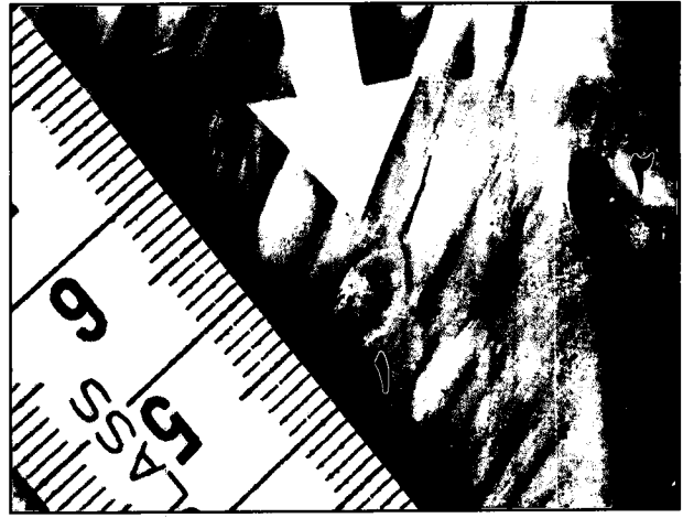
تصویر ۱- سیستی سرکوس بویس در جدار شکمبه گاو. ۱- سیستی سرکوس بویس. ۲- مخاط شکمبه.