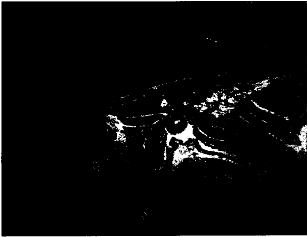
تصویر ۲- سیستی سرکوس بویس در بافت همبند بین لایه سروزی و سطح بیرونی لایه ماهیچه ای خارجی شکمبه. ۱- سیستی سرکوس بویس. ۲- لایه خارجی ماهیچه دیواره شکمبه. ۳- مخاط شکمبه (رنگ آمیزی H&E، بزرگ نمایی ۱۶x).