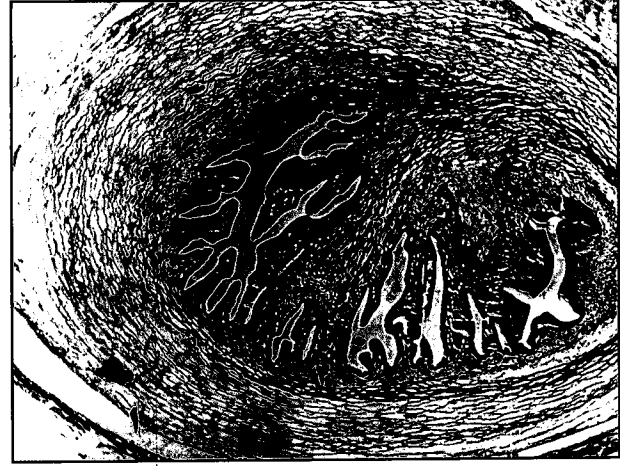
تصویر ۳- مقطع سیستی سرکوس بویس. ۱- دیواره کیسه سیستی سرک. ۲- اجسام آهکی (رنگ آمیزی H&E، بزرگ نمایی ۶۴x).

در این بررسی کلیه سیستی سرک ها در بافت همبندی بین پوشش مزوتلیال لایه سروزی و سطح بیرونی لایه خارجی عضلات دیواره شکمبه جای گرفته بودند و در سایر قسمتهای آن بویژه در لایه های عمقی تر عضلات دیواره شکمبه متاستودی یافت نشد و محل آنها تا حدودی با محل جایگزینی سیستی سرک ها در قلب مشابه بود هر چند سیستی سرک های دیواره قلب در مقایسه با شکمبه، به نسبت عمیق تری در بین دستجات ماهیچه ای جایگزین شده بود. تاکنون محل جایگزینی سیستی سرک ها در دیواره شکمبه در آلودگی طبیعی گزارش نشده است. طبق نظر Hubbert و همکاران در سال ۱۹۷۵، سیستی سرکوس بویس در عضلات قلب در فضاهای لنفاتیکی بین دستجات فیبرهای ماهیچه ای و در سایر ماهیچه ها در بافت همبندی جدا کننده دستجات سلولهای عضلانی جاسازی می شوند (۷). در بررسی مقایسه ای میان ضایعات میکروسکوپی ایجاد شده توسط سیستی سرک ها در شکمبه و قلب همان حیوان، واکنش آماسی ایجاد شده در برابر انگل در قلب و شکمبه تا حدود زیادی یکسان بود اما در قلب، کپسول اطراف سیستی سرک ها، علاوه بر ضخامت بیشتر دارای تعداد زیادتری لمفوسیت نیز بودند.