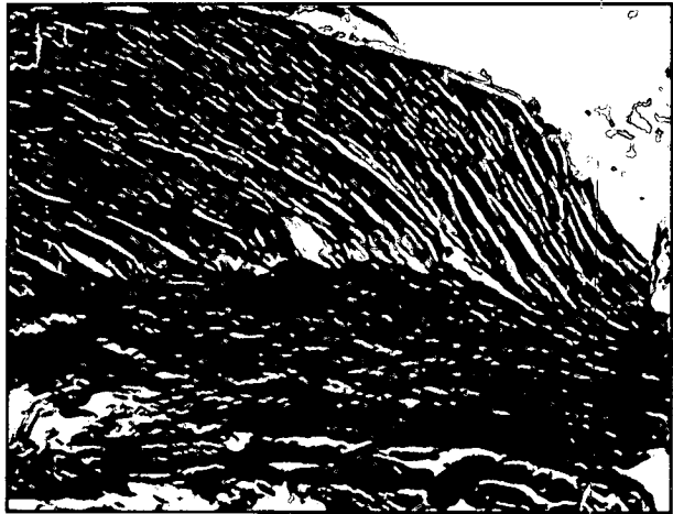
تصویر ۵ - نمونه بافت تهیه شده از گروه شاهد مثبت در روز ۶۰ تصویری از محل الصاق دستجات رشته های کلاژن بافت التیامی با رشته های عضلانی مخطط. به یکنواختی و آرایش منظم رشته های کلاژن و جهت قرار گیری غیر موازی رشته های کلاژن نسبت به رشته های عضلانی توجه نمایید (H&E و ۱۰۲x).