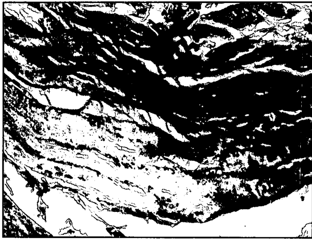
تصویر ۶ - نمونه بافت تهیه شده از گروه آزمایش در روز ۶۰ تصویر تهیه شده از توده بافت التیامی در نزدیکی محل قطع شده سلولهای عضلانی. رشته های کلاژن تشکیل شده از نظم و آرایش هم جهت با یکدیگر برخوردار بوده و در لابلای آنها بقایای سلولهای عضلانی که در حال دژنره شدن می باشند حضور دارند. این سلولها با هسته هایی متعدد در موقعیت مرکزی و با نام دیو سلولهای عضلانی در مرکز تصویر مشخص هستند (H&E و ۲۲۴x).

از مداخله طب سوزنی پس از قطع عصب اولیه آنها و برقراری دوباره ایمپالس های عصبی در این رشته ها باشد (تصویر ۷).