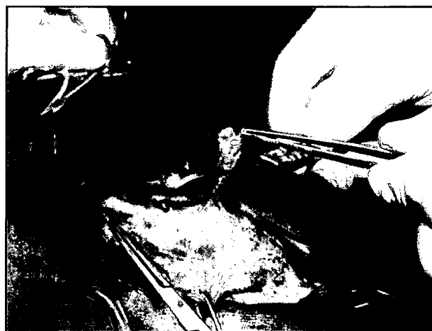
تصویر ۱ - برداشت بخشی از عضله biceps femoris سمت راست.