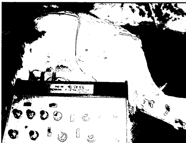
تصویر ۲ - مقید کردن دام و نحوه تثبیت سوزن های طب سوزنی.