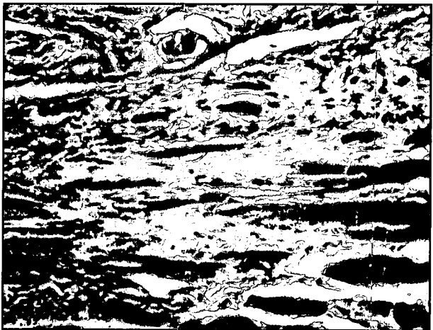
تصویر ۷ - نمونه بافت تهیه شده از گروه آزمایش در روز ۶۰ تصویری از محل اتصال دستجات رشته ای کلاژن بافت التیامی به انتهای قطع شده رشته های عضلانی مخطط. به یکنواختی و آرایش منظم رشته های کلاژن و جهت قرار گیری موازی و هم جهت رشته های کلاژن نسبت به رشته های عضلانی توجه نمایید (H&E و ۲۸۸x).

واکنش رزرنراتیو را از خود نشان می دادند (تصویر ۵) و در بررسی تعداد ۵ عدد مقطع بافتی تهیه شده از نمونه های آزمایش تحت درمان با طب سوزنی در مقاطع مزبور ساختمان طولی و عرضی رشته های عضلانی مخطط در کنار بافت همبند بالغ و توسعه یافته اسکار همراه با ویژگیهای مربوطه دیده می شد. نتایج حاصل از تبدیل این ویژگیها به معیارهای قابل مقایسه در جدول ۲ منعکس گردیده است. در این گروه نیز همانند گروه شاهد مثبت بروز واکنشهای فیبروبلاستیک افزایش ضخامت و بسط و توسعه بافت همبند پری میزیوم را در اطراف دستجات عضلانی سبب گردیده بود که اختلاف چندانی بین دو گروه از نظر ایجاد این بافت مشاهده نشد (تصویر ۶).