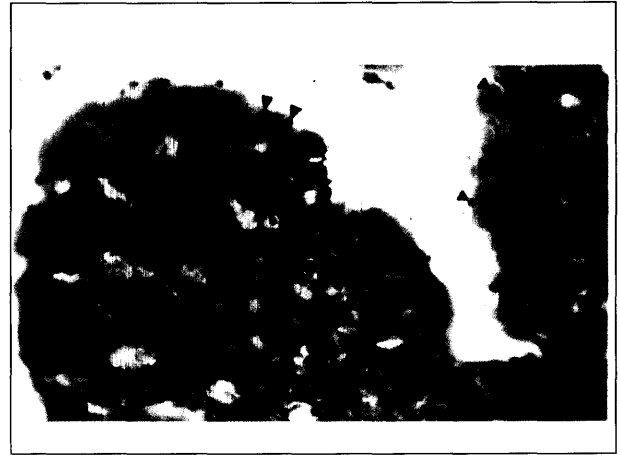
تصویر ۱- هایپر بلازی سلولهای بافت پوششی و حضور تعداد بسیار زیادی از اجرام مدور بازوفیلیک کریپتوسپوریدیایی مشهود است (نوک پیکانها) (رنگ آمیزی هماتوکسیلین و انوزین ۴۰۰×).

یاخته مذکور عمدتاً در نواحی میانی روده (ایلئوم و ژوژنوم) استقرار میابد و از سوی دیگر شدت آلودگی نیز در این نواحی بیشتر از قسمتهایی نظیر سکوم و دودنوم است (جدول ۱). همچنین نگارنده در مطالعات گذشته نگر، مرجعی مبنی بر گزارش آلودگی کریپت ها در گونه های پرنده مواجه نشده است.