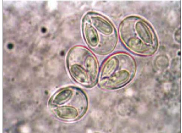
تصویر ۱- اسپوره های خارج شده از کیست میکسوبولوس کارونی از آبشش ماهی شیریت (رنگ آمیزی نشده، ۱۷۸×).