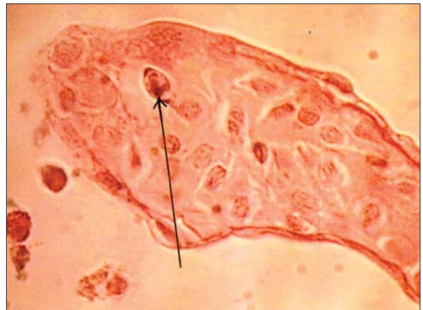
تصویر ۵- مراحل اولیه رشد سودو پلازما در شعاع های ثانویه آبشش، H&E ۱۹۰×.