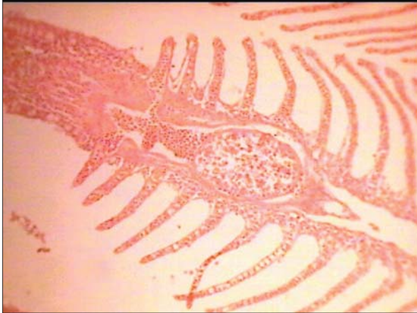
تصویر ۲- مراحل رشد میکسوبولوس کارونی. مراحل اولیه سودو پلازما، در بافت اپیتلیوم آبشش ماهی برزم H&E ۲۴۰×.