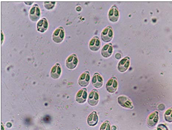
تصویر ۴- اسپوره های خارج شده از کیست میکسوبولوس پرسیکوس M. persicus از آبشش ماهی شیریت (رنگ آمیزی نشده، ۱۰۰×).