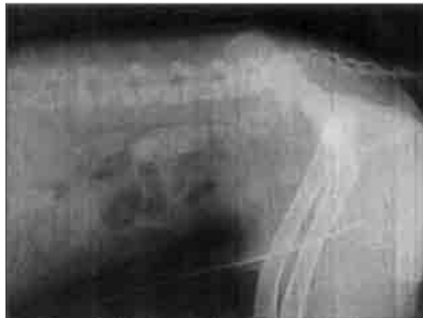
تصویر ۱- رادیوگرافی ساده از نمای جانبی محوطه شکمی سگ شماره ۷. محدوده‌ی پروستات در این رادیوگراف مشخص نیست.