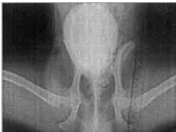
تصویر ۴- اورتروسیستوگرافی از نمای شکمی - پشتی محوطه شکمی سگ شماره ۷. در این نما به دلیل روی هم افتادن تصویر استخوانها و مدفوع، محدوده‌ی پروستات مشخص نیست.