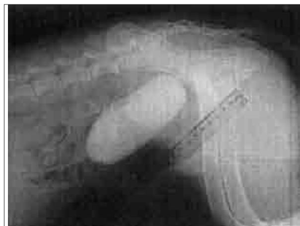
تصویر ۳- اورتروسیستوگرافی از نمای جانبی محوطه شکمی سگ شماره ۶. در این تصویر به دلیل قرارگرفتن پروستات در داخل لگن، محدوده‌ی آن مشخص نیست.

اولتراسونوگرافی هیچگونه نشانی غیرطبیعی در پروستات سگهای این بررسی مشاهده نشد که در کالبد گشایی نهایی نیز سالم بودن پروستات و ارگانهای اطراف آن مورد تایید قرار گرفت. به عبارت دیگر علیرغم اینکه سگهای مذکور به دلایلی جهت مرگ بی درد و آسان ارجاع داده شده بودند ولی هیچیک مشکل مربوط به دستگاه ادراری- تناسلی را نداشته و از این لحاظ حیواناتی سالم محسوب می‌شدند.