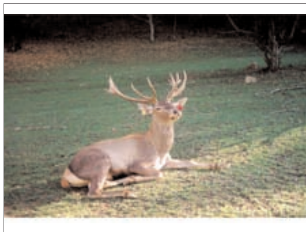
تصویر ۱- عکسی از یک گوزن قرمز نر بالغ زیر گونه مارال در آیتالو، منطقه حفاظت شده ارسباران (آذربایجان شرقی).