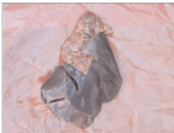
تصویر ۳- کبد گوساله مارال مبتلا به آندوتوکسمی ناشی از عفونت توام اشریشیاکلی و کلبسیلا پنومونیه، پر خونی شدید بافت کبد مشهود است.

آزمایشگاه میکروب شناسی دانشکده دامپزشکی دانشگاه تهران ارسال گردید. نتایج مشابه نتایج بدست آمده در آزمایشگاه باکتری شناسی دانشکده دامپزشکی دانشگاه تبریز بود. در سروتاپینگ اشریشیاکلی از آنتی سرم ساخت شرکت بهارافشان - ایران استفاده گردید. باکتری جدا شده به آنتی سرم پلی والان پلی ۴ که حاوی آنتی سرم‌های O 20 و O 114 بود پاسخ داد. کلبسیلا پنومونیه تیپ K ۱ ، توسط آنتی سرم شرکت MAST - انگلستان شناسایی شد.