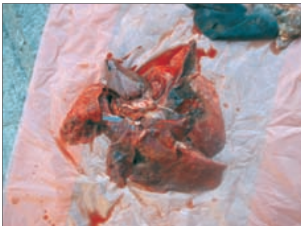
تصویر ۲- ریه گوساله مارال مبتلا به آندوتوکسمی ناشی از عفونت توام اشریشیاکلی و کلبسیلا پنومونیه، پرخونی شدید و ادم ناشی از شوک ریوی جلب توجه می‌کند.