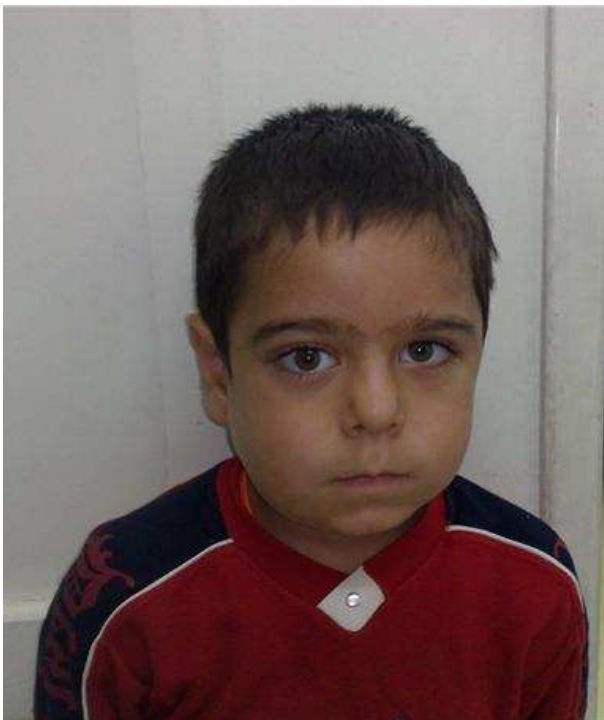
شکل ۱. بیمار با شکایت ضایعه‌ی بدون درد منفرد استخوان فک تحتانی سمت چپ مراجعه نمود.

سانتی متر با گسترش به سمت ناحیه‌ی خلفی - تحتانی استخوان فک تحتانی مشاهده و لمس شد. در معاینه‌ی برآمدگی (توده) از طرف داخل دهانی مورد خاصی مشاهده نشد. در ناحیه‌ی تحت فکی، لنفادنوپاتی وجود نداشت. یافته‌های حاصل از معاینه‌ی فیزیکی احتمال کیست پریدنتال و یا استئومیلیت مزمن را مطرح کرد.