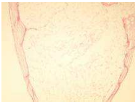
شکل ۳. نکروز چربی تروماتیک در اسفروئید زیرجلدی (بزرگ‌نمایی ۱۰۰)

ندولر خاکستری رنگ به اقطار 1/5 \times 1/3 سانتی‌متر و ضخامت 0/8 با ناحیه‌ی قهوه‌ای رنگ برجسته و زخمی به قطر ۱ سانتی‌متر و در زانوی راست، ندول پوستی با سطح خاکستری رنگ به قطر 1/5 و ضخامت 0/8 سانتی‌متر با قوام نیمه سفت و سطح مقطع با نواحی قهوه‌ای رنگ وجود داشت. در بررسی میکروسکوپی ندول ساعد راست، بافت چربی نکروتیک دیده می‌شد (شکل ۳) که توسط لایه ضخیمی از کلاژن متراکم احاطه گردیده بود. این ضایعه با نکروز چربی تروماتیک مطابقت داشت که به