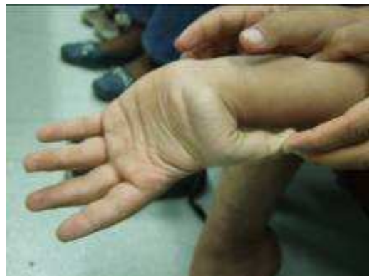
شکل ۲. دورسی فلکشن انفعالی انگشت شست به سمت ساعد

صورت ندول‌های زیرجلدی اسفروئید با قوام سفت در برخی از موارد EDS وجود دارد. در نمونه‌ی پوست آرنج چپ، ناحیه‌ی هموراژیک با حاشیه‌ای متشکل از بافت گرانولاسیون در درم دیده می‌شد. مرکز پوست زخمی بود و تغییرات هیپرپلاستیک در اپی‌درم مجاور آن دیده می‌شد. این تغییرات دال بر هماتوم تروماتیک بود که از لحاظ بالینی ضایعه‌ی Psudotumor با قوام نرم و سطح چین خورده (مولوسکوئید) ایجاد می‌نماید. در ندول پوست زانوی راست، کیست کراتینی با پارگی جدار (شکل ۴) و آماس برجسته‌ی جسم خارجی در درم حاشیه آن وجود داشت.