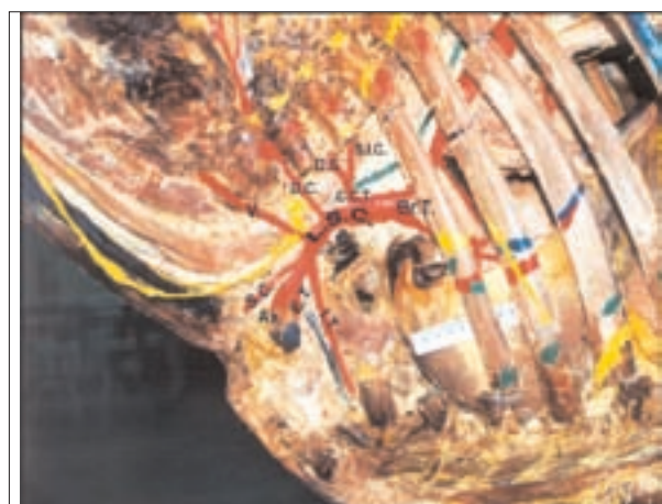
تصویر ۳- نمای سمت چپ، تنه بازویی سری و انشعابات سرخرگ زیرترقوه‌ای چپ (نمونه فیکس شده ۳). نامگذاری مطابق با شرح تصویر ۱ می‌باشد.

محل جدا شدن سرخرگ مهره‌ای سمت راست در تمام نمونه‌های فیکس شده در محدوده‌ای از مقابل دنده ۱ تا فضای بین دنده‌ای ۱ و در طرف چپ از مقابل دنده ۱ تا مقابل دنده ۲ مشخص گردید (تصویر ۲). در نمونه تازه ۲ در سمت راست و چپ به ترتیب در مقابل دنده ۲ و در فضای بین دنده‌ای ۲ (ولبه خلفی دنده ۲) تعیین شد.