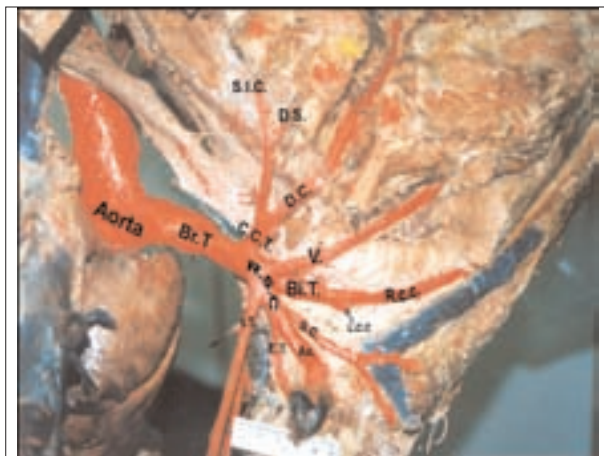
تصویر ۲- نمای سمت راست، تنه بازویی سری و انشعابات سرخرگ زیرترقوه‌ای راست (نمونه فیکس شده ۲). نامگذاری مطابق با شرح تصویر ۱ می‌باشد.