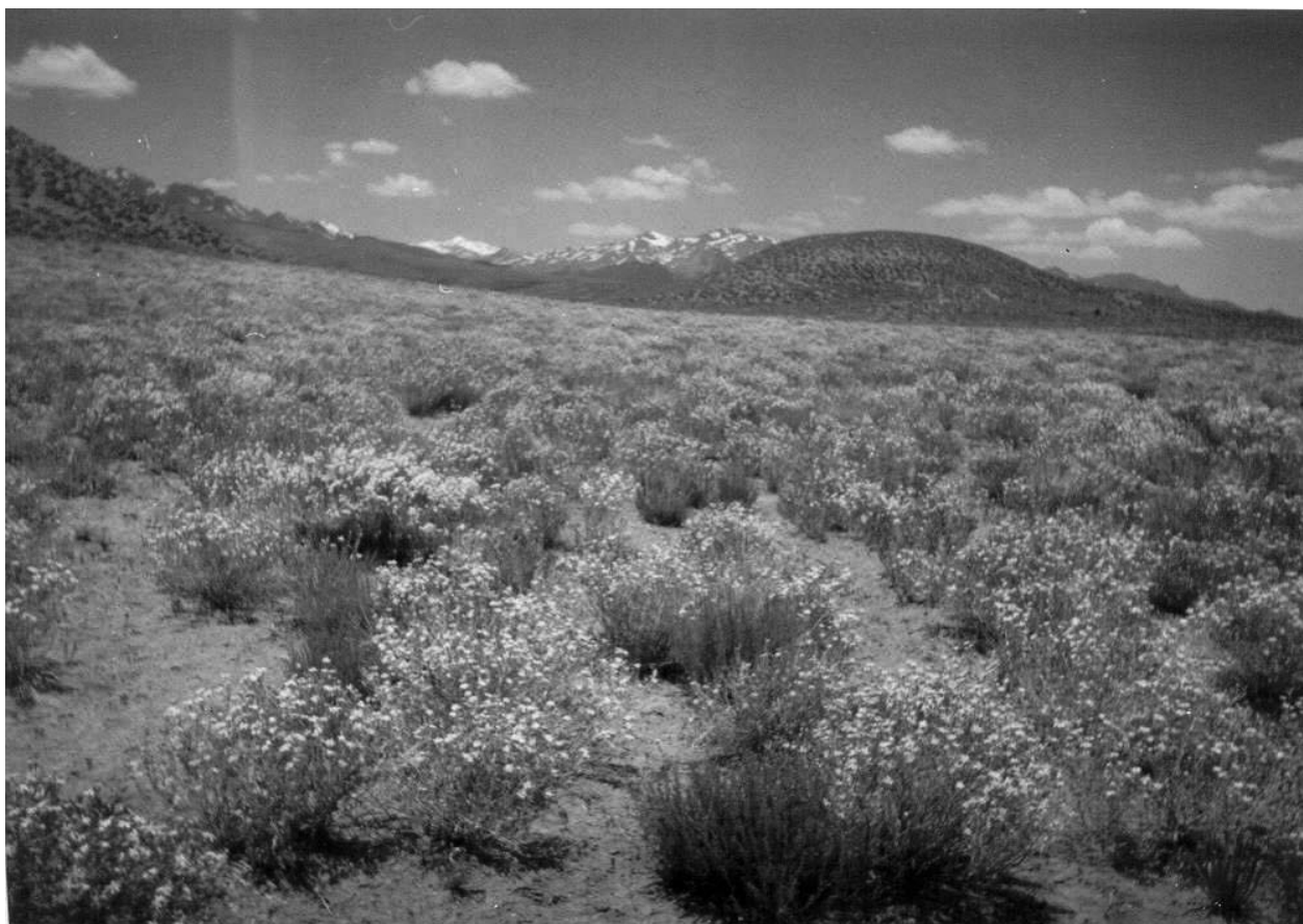
Hertia Intermedia رویشگاه گیاه