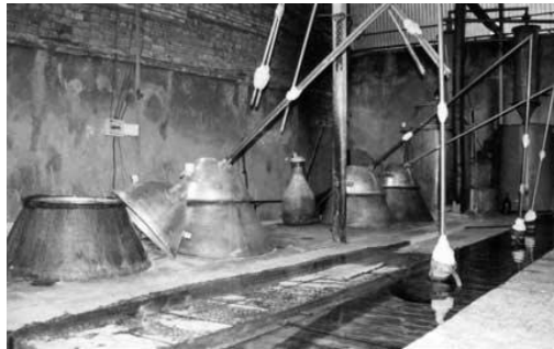
شکل ۱- نمونه ای از یک کارگاه گلابگری سنتی در کاشان

آشنایی دارد. به علت مشکلات کیفی شامل عدم یکنواختی رنگ، ترکیبهای شیمیایی، ویژگیهای بهداشتی و بسته‌بندی بازار آن دچار نوسان شده است.