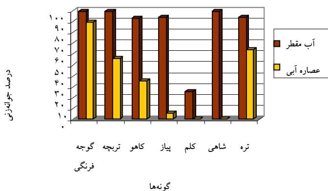
شکل ۱- تأثیر عصاره آبی و آب مقطر بر درصد جوانه‌زنی بذرهای چند گونه از سبزیجات