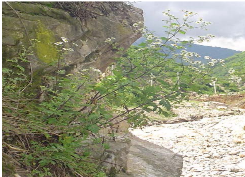
شکل ۱- تصویری از گیاه Tanacetum parthenium در منطقه زیارت