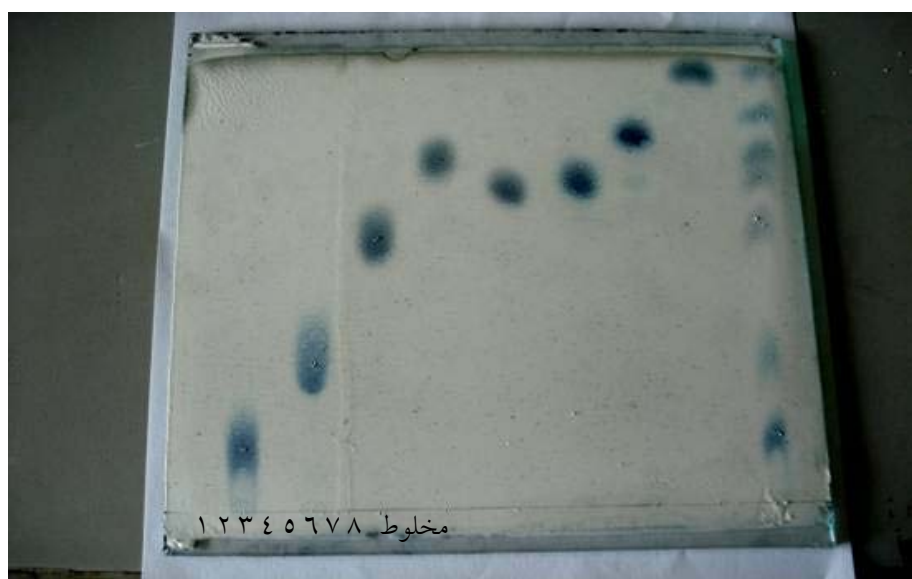
شکل ۲- لکه‌های تشکیل شده در صفحه کزل گور G (به دو حالت جداگانه و مخلوط استاندارد)