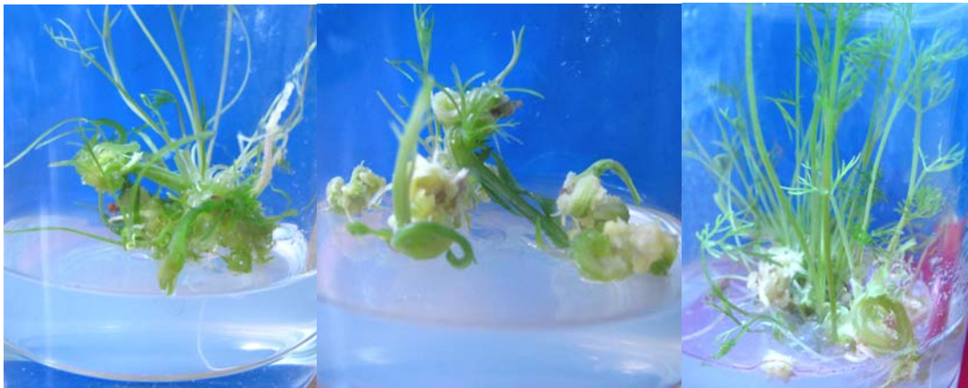
شکل ۱- اندام‌زایی کالوس حاصل از ریزنمونه‌های هیپوکوتیل، مریستم انتهایی و ریشه در محیط فاقد هورمون (به ترتیب از راست به چپ)