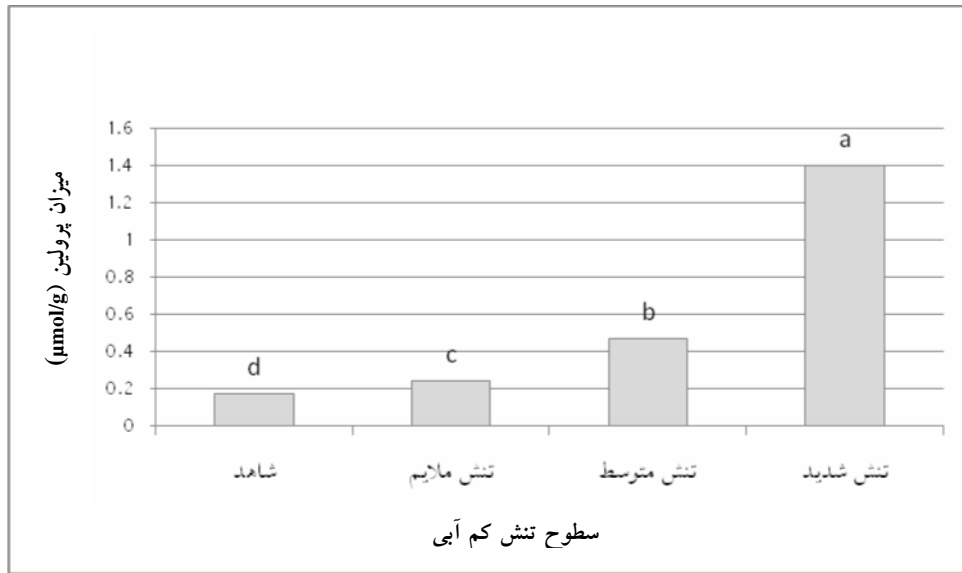
شکل ۱- اثر سطوح تنش خشکی بر میزان تجمع پرولین در برگ‌های آویشن ( Thymus vulgaris L. )