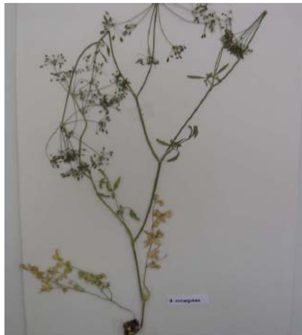
شکل ۲- تصویری از Bunium rectangulum

دمگل‌ها تا ۲۰ تایی، در حالت گلدار به طول ۲ تا ۴ میلی‌متر و در حالت میوه‌دار به طول ۱۰ تا ۱۵ میلی‌متر، نازک و گسترده هستند. گلبرگها سفید، به درون پیچیده، کوچک، به سختی به طول تا ۱ میلی‌متر می‌باشند. میوه‌ها به طول حدود ۲ تا ۳ و عرض ۱ تا ۱/۵ میلی‌متر و