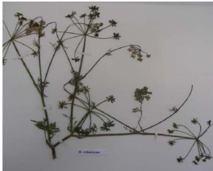
شکل ۱- تصویر گیاه Bunium cylindricum

مستطیلی هستند. پره‌ها نوک‌تیز؛ پایک خامه توسری خورده و خامه‌ها برگشته‌اند. فصل گلدهی و میوه‌دهی اواسط بهار تا اوایل تابستان است. پراکنندگی جغرافیایی آن در ایران (غرب، مرکز و جنوب) و عراق است. در شکل ۲ تصویری از این گیاه دیده می‌شود.