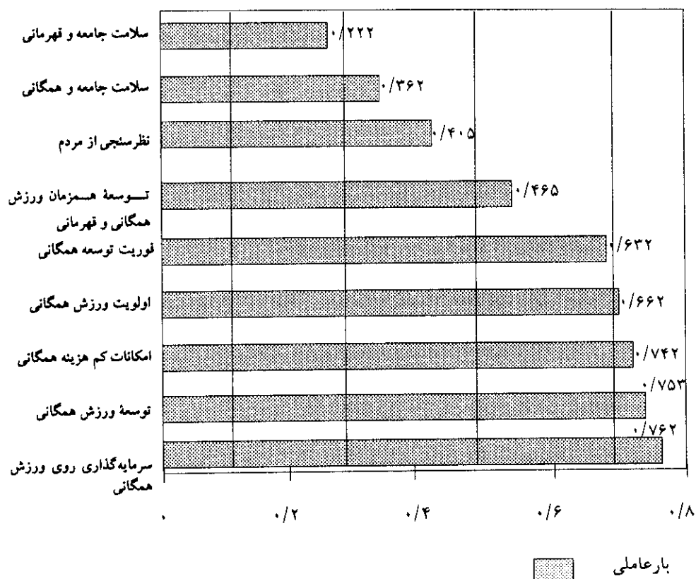
نمودار ۱- بار عاملی اجزای درونی متغیر تقاضای اجتماعی برای ورزش همگانی و قهرمانی

این است که گسترش ورزش همگانی را سرلوحه برنامه‌های دراز مدت خود قرار دهند. در غیراین صورت باید در انتظار آمارهای نگران‌کننده بیماری‌ها، غیبت از کار در اثر بیماری‌های ناشی از کم‌تحرکی، افزایش مرگ و میر و کاهش سطح بهداشت عمومی باشیم. نمودار ۱ بار عاملی هر کدام از اجزای درونی متغیر تقاضای اجتماعی برای ورزش همگانی و قهرمانی را نشان می‌دهد.