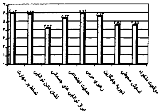
نمودار ۱ - مقایسه میانگین های منابع اعتماد به نفس

براساس نتایج به دست آمده از منابع کسب اعتماد به نفس در جدول ۱ تسلط بر مهارت با میانگین ۷/۰۳ مهم ترین عامل کسب اعتماد به نفس و ابراز توانایی های جسمانی (از سوی خود) با میانگین ۴/۲۴ کم اهمیت ترین عامل ایجاد اعتماد به نفس از سوی بازیکنان شناخته شد. فضای انگیزشی تکلیف مدار با میانگین ۴/۱۷ نسبت به فضای انگیزشی خودمدار و تکلیف مداری با میانگین ۴/۴۸ نسبت به خودمداری در سطح بالاتری قرار داشت.