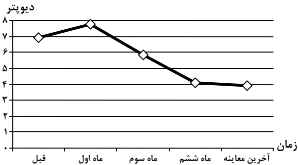
نمودار ۴- روند تغییرات میانگین آستیگماتیسم توپوگرافیک بیماران از قبل از عمل تا آخرین پی‌گیری