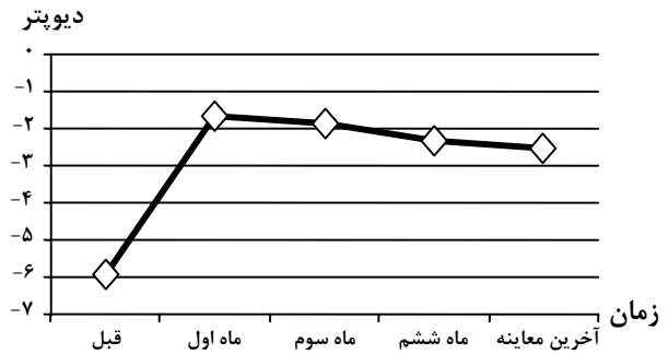
نمودار ۳- روند تغییرات میانگین معادل کروی بیماران از قبل از عمل تا آخرین پی‌گیری