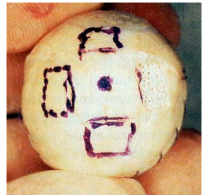
تصویر ۱- محل تعبیه ۴ دریچه بر روی صلیبه دهنده پوشاننده هیدروکسی آپاتیت