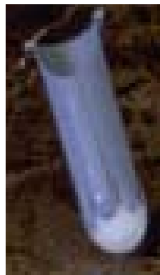
تصویر ۲- اینسرتور (insertor) مخصوص کارگذاری ایمپلنت مدپور