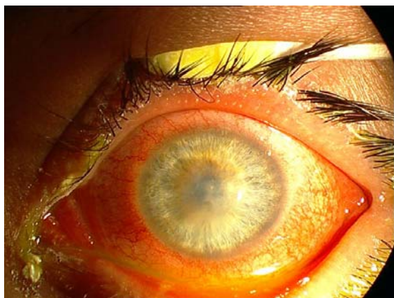
تصویر ۵- اسکار قرنیه همراه با شروع واسکولاریزیشن بستر استروما، ۱۲ هفته بعد از شروع درمان.