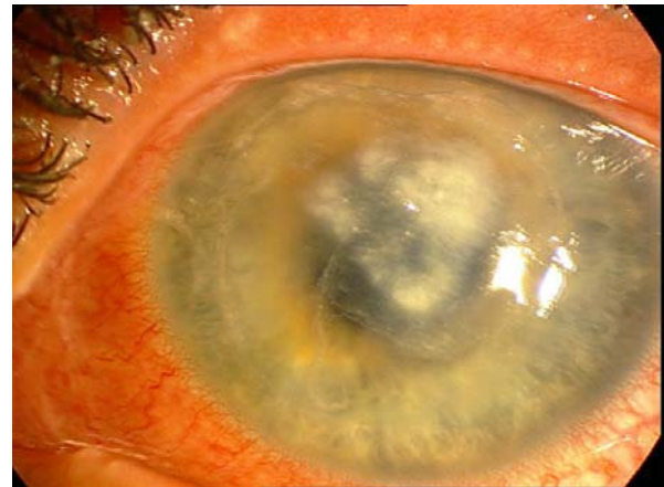
تصویر ۱- قرنیه بیمار در اولین مراجعه: فلپ ادماتو همراه با ارتشاح در ناحیه سطح فاصل با کناره های پرمانند (feathery).

ناتامایسین ۵ درصد، هر یک ساعت و کتوکونازول سیستمیک ۲۰۰ mg دو بار در روز همراه با قطره هماتروپین ۲ درصد شروع شد. چهار هفته بعد از شروع درمان، ارتشاح استروما به میزان قابل توجهی کاهش یافت (تصویر ۴). در آخرین پی گیری (۳ ماه بعد از انجام لیزیک)، بستر استرومای زخم، وسکولاریزه شد (تصویر ۵) و حدت بینایی در حد ۲۰/۲۰۰ بود.