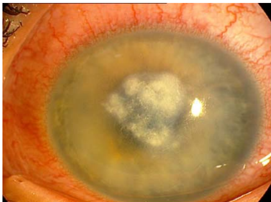
تصویر ۳- نمای بالینی قرنیه بعد از قطع فلپ: ارتشاح عمقی استروما با کناره های پرمانند مشهود است.