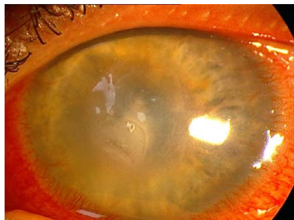
تصویر ۴- نمای بالینی قرنیه یک ماه بعد از شروع درمان: ارتشاح استروما رو به بهبود است.