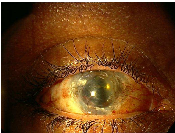
تصویر ۱- نمای اسلیت‌لپ، یک هفته پس از تخلیه مایع مشیمیه‌ای

مرد ۳۵ ساله‌ای با تشخیص گلوکوم زاویه بسته ثانویه، تحت عمل جراحی کاشت دریچه احمد (Ahmed glaucoma valve) قرار گرفت. در سابقه پزشکی بیمار، سوختگی شیمیایی چشم راست و