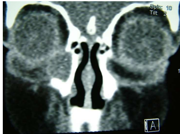
تصویر ۲- توده داخل کیسه اشکی سمت راست در CT-اسکن حدقه

شکنندگی بافت عروقی این توده است. ۸ گرانولومای پیوژن در کیسه اشکی، به صورت اولیه و یا ثانویه به التهاب، تروما و اجسام خارجی هم‌چون لوله سیلیکون پس از عمل DCR مشاهده می‌شود. ۱ با توجه به نبود علائم در کودک قبل از ۸ ماهگی از یک طرف و وجود سابقه چند بار میل‌زدن، بروز گرانولومای پیوژن را می‌توان به صورت اولیه و یا ثانویه به ترومای جراحی و التهاب‌های ناشی از آن نسبت داد.