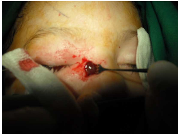
تصویر ۳- خروج توده از کیسه اشکی