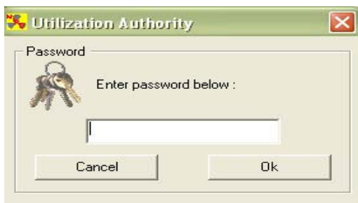
شکل ۲ - وارد نمودن رمز عبور

جهت محاسبه دوزبیمار ناشی از پرتوگیری داخلی در پزشکی هسته ای (دوز موثر رسیده به ارگان هدف ( D_{rk} ) بر اساس رابطه ۱ نیاز به محاسبه اکتیویته تجمعی ( A_h ) و سایر اطلاعات مربوط به پارامترهای محاسبه دوز پرتوگیری داخلی می باشد. این اطلاعات از طریق ورود متغیرهای تکنیکی از قبیل اکتیویته تزریقی، ارگان منبع، ارگان هدف و مشخصات ماده رادیواکتیو تزریقی به نرم افزار مورد استفاده قرار گرفت. ضمناً فاکتور S بدست آمده از رفرانس ICRP (International Commission on Radiation Protection) (۱۵-)