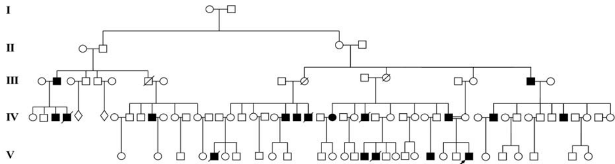
شکل ۱- بیمار مراجعه کننده دارای پدر، عمو، عمه، پسرعمو و دو پسرعمه مبتلا می‌باشد. عمو و یکی از پسرعمه‌های بیمار به دلیل ابتلا به این بیماری فوت شده‌اند. موارد دیگری از ابتلا نیز در خویشاوندان دورتر پروباند وجود دارد که در شجره‌نامه مشخص است. شجره‌نامه نشان می‌دهد که بیماری مذکور در این خانواده‌ها دارای الگوی وراثتی اتوزومال غالب با نفوذ کاهش یافته بوده و بروز آن تحت تأثیر جنس می‌باشد.

است. همچنان که در شجره‌نامه دیده می‌شود در این شجره‌نامه موارد متعددی از انتقال مرد به مرد بیماری دیده می‌شود. لذا این بیماری نمی‌تواند وابسته به X باشد. از طرف دیگر به جز یک مورد (پروباند) در هیچ یک از موارد، بیماری حاصل ازدواج فامیلی نبوده و در اکثر موارد هر بیمار دارای یک والد و یا یک جد مبتلا می‌باشد. لذا به نظر می‌رسد بیماری دارای الگوی وراثتی اتوزومال غالب با نفوذ کاهش یافته است. این که از ۱۸ بیمار مشاهده شده در این شجره‌نامه ۱۷ بیمار مرد بوده و تنها یک بیمار زن می‌باشد، حاکی از آن است که بروز این بیماری تحت تأثیر جنسیت قرار دارد.