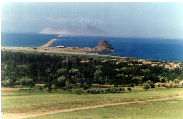
عکس ب - حالت طبیعی میان‌گذر و ارتباط با ساحل غربی