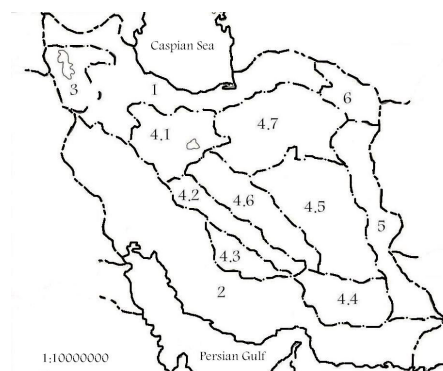
نقشه ۱- موقعیت حوضه ۳ نسبت به سایر حوضه‌ها [۴و۱]

حوضه آبریز دریاچه ارومیه در شمالغرب ایران یکی از حوضه‌های بسته می‌باشد که نسبت به تقسیم‌بندی حوضه‌های آبریز ایران، حوضه آبریز شماره (۳) بوده و موقعیت آن مطابق نقشه شماره (۱) مشخص می‌گردد [۴و۱]. از نظر تقسیمات زیر حوضه‌ها در داخل حوضه آبریز، مطابق نقشه شماره (۲) حدود تقسیمات زیرحوضه‌های آبریز دریاچه ارومیه تعیین می‌شود که از مجموع حوضه‌های رودخانه‌ای تشکیل شده که قبلاً در مورد آنها مطالعاتی توسط سازمان آب منطقه آذربایجان شرقی، دانشگاه تبریز و جهاد سازندگی انجام گرفته و در مطالعات حاضر حوضه دریاچه ارومیه به صورت S یکپارچه مورد مطالعه قرار می‌گیرد.