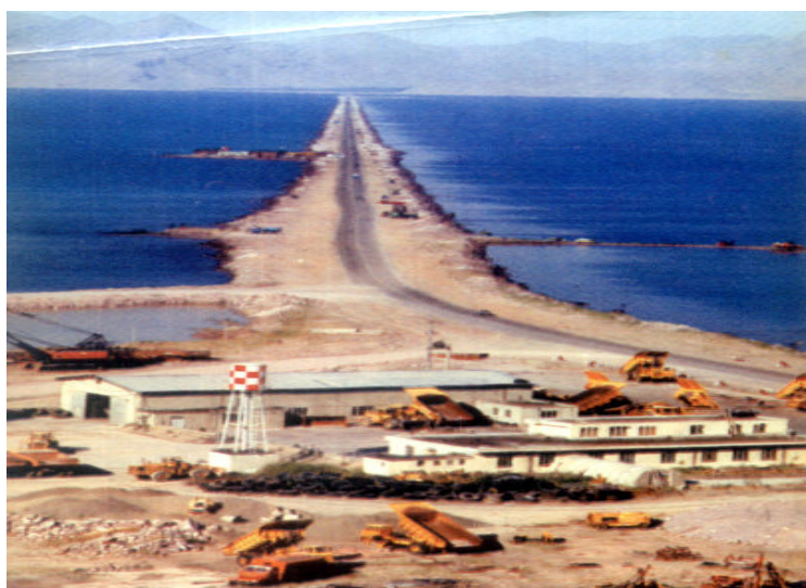
عکس الف - حالت طبیعی میان‌گذر و ارتباط آن با ساحل شرقی

احداث میان گذر و تقسیم حوضه آبریز دریاچه به دو قسمت مسئله مهم و جدیدی بوده و قابل بررسی می‌باشد؛ به ویژه نقش مؤثر میان گذر در طرح آبگذر و همین‌طور موضوع رسوب در