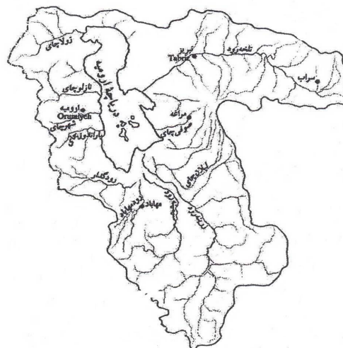
نقشه ۲- حدود تقسیمات زیر حوضه‌های آبریز