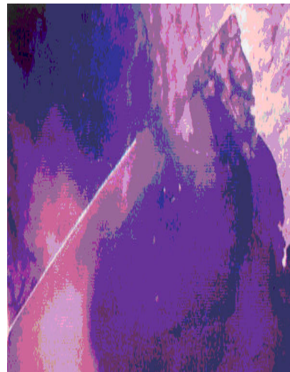
عکس ۳- تصویر ماهواره اسپات ۱ از میانگذر و طبقه‌بندی نظارت نشده نحوه پراکنش مواد معلق و غلظت نسبی آنها [۱۶]

همچنان که در عکس (۱) (قبل از احداث میان گذر) رنگ سبز آبی تصویر نتیجه تأثیر پراکنش همگون مواد معلق در دریاچه است، در عکس (۳) انباشتگی بیشتر و افزایش ارتفاع لجن در ضلع جنوبی بدنه میان گذر را شاهد هستیم [۱۶].