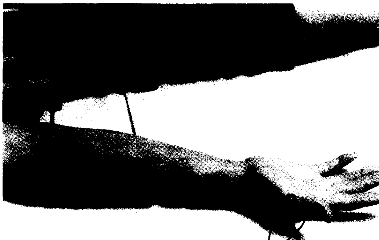
شکل ۲ - کاتد محرک ۸ cm بالاتر از G_1 در بین تاندون عضله فلکسور کاریبی‌رادیالیس و پالماریس لونگوس قرار می‌گیرد و تحریک پروگزیمال در ناحیه آرنج در سمت داخلی تاندون عضله دوسر داده می‌شود