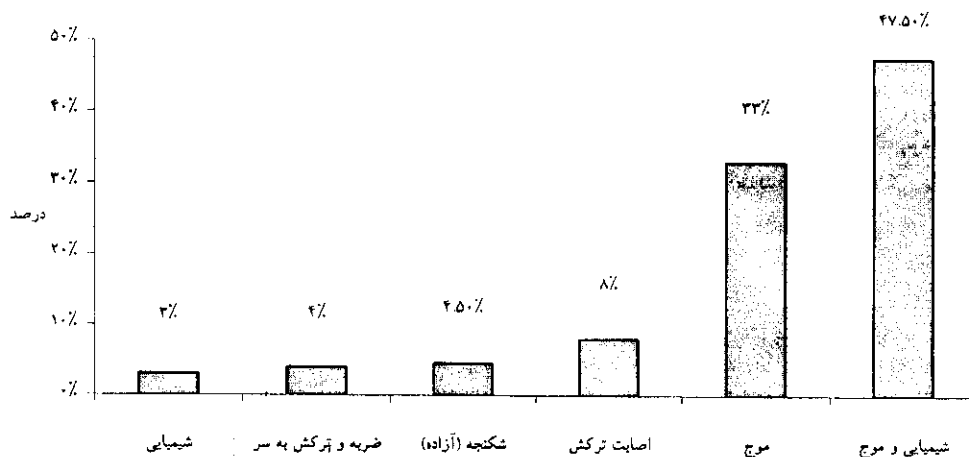
نمودار ۱- چگونگی آسیب در ۲۰۰ نفر از جانبازان تحت بررسی

۹۵ نفر یا ۴۷/۵٪ مجروحیت شیمیایی و موج گرفتگی، ۶۶ نفر یا ۳۳٪ موج گرفتگی، اصابت ترکش، ۱۶ نفر (۸٪) مجروحیت شیمیایی و اصابت ترکش) ۹ نفر (۴/۵٪) آزاده بوده و علاوه بر مجروحیت شیمیایی و ترکش در دوران اسارت شکنجه شده بودند، ۸ نفر (۴/۱٪) مجروحیت شیمیایی - اصابت ترکش، تصادف با ماشین و ضربه به سر، ۶ نفر (۳٪) فقط مجروحیت شیمیایی. (نمودار ۱)