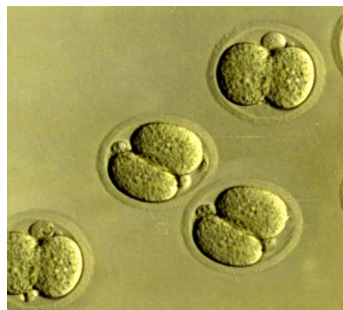
تصویر-۱: جنین‌های به دست آمده در مرحله دو سلولی.

جهت IVF نمونه‌های اسپرم به مدت دو ساعت در داخل انکوباتور CO_2 انکوبه شدند تا ظرفیت‌پذیری را به دست آورند. آنگاه، اووسیت‌های مرحله متافاز II را در قطرات محیط کشت T6 قرار داده و اسپرم‌ها افزوده شده و به مدت ۴-۶ ساعت در انکوباتور CO_2 انکوبه شدند. سپس اووسیت‌ها جهت شستشو به محیط کشت جدید منتقل گردیدند تا اووسیت‌های لقاح یافته در محیط کشت جدید حاوی مواد غذایی کافی رشد نموده و به مرحله دو سلولی برسند. در نهایت در صبح روز بعد تعداد جنین‌های دو سلولی را شمارش نموده و از این طریق میزان لقاح در هر یک از گروه‌های آزمون و کنترل محاسبه گردید (تصویر شماره ۱). برای مقایسه گروه‌های آزمون با گروه کنترل از نرم افزار SPSS و آزمون آماری t-test استفاده شد.